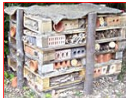
Adeiladu Plasty Trychfilod gydag Ymddiriedolaeth Tywysog Cymru!

Gallwch drefnu i dîm prosiect i ddod i'ch ysgol, i helpu i ddatblygu'r awyr agored. Maent wedi adeiladu Plastai Trychfilod, Pyllau Tân, dosbarthiadau awyr agored bach etc. ac wedi ennill gwobr am y gwaith maent wedi'i wneud mewn ysgolion lleol. Am fwy o wybodaeth gefndir, ewch i: www.princes-trust.org.uk neu gallwch wneud cais ar-lein yn www.swanseagfl.gov.uk