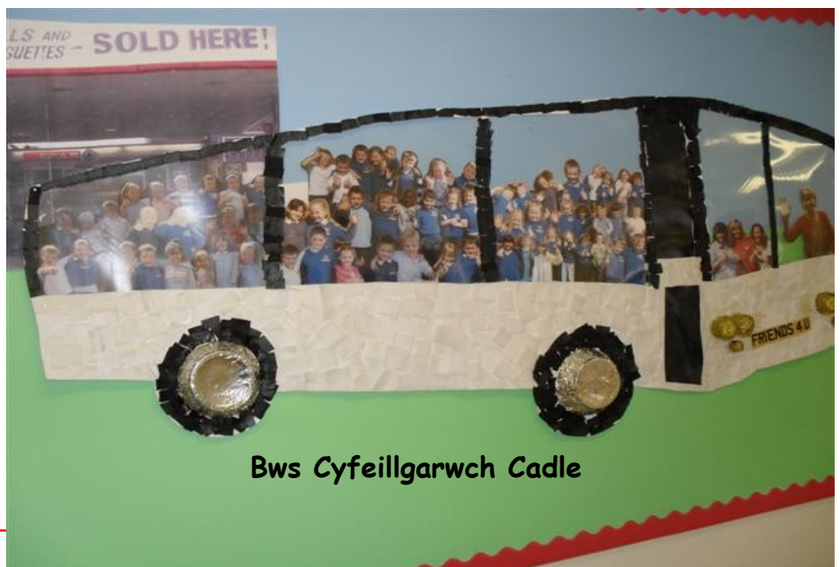
Bws Cyfeillgarwch Cadle

Anfonwch lun o'ch ysgol sy'n gwneud i chi wenu.